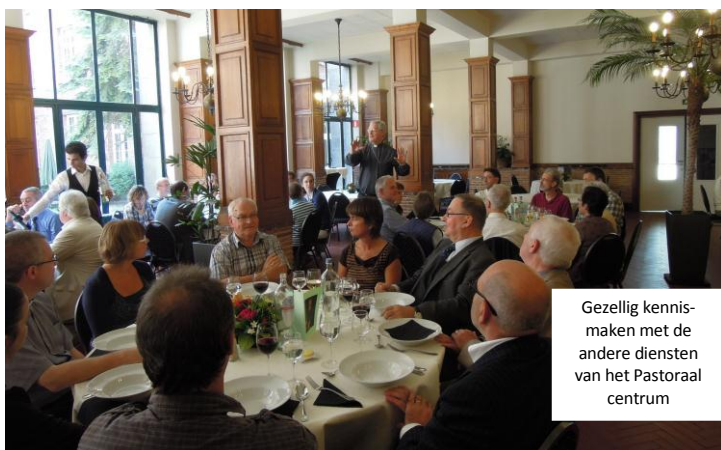
Gezellig kennismaken met de andere diensten van het Pastoraal centrum